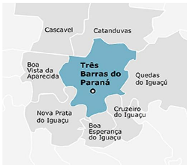
Imagem 2 – Limites e Confrontações do município de Três Barras do Paraná

FONTE: IPARDES NOTA: Base Cartográfica ITCG (2010).